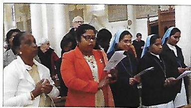
La communauté indienne de Nevers dans sa diversité, s'est déplacée pour entourer le jeune prêtre

L'arrivée d'un nouveau curé est toujours un moment de grande émotion teinté de gravité, de solennité, de joies et d'espérance, mais aussi d'interrogations. Ce dimanche était donc à la fête sur les hauteurs morvandelles. Des visages inhabituels de religieuses et familles indiennes se mêlaient gaiement aux nombreux paroissiens, venus des vingt-trois clochers associés, le plus éloigné étant celui de Dun-les-Places, rattaché depuis peu au regroupement.